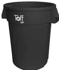
9185NE BOTE TOFF 120L NEGRO