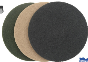
DISCO ABRASIVO 19" COD: JR036, JR037, JR038