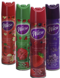
AROMATIZANTE EN AEROSOL WIESE 400 ML COD: QM067, QM064, QM069, QM044