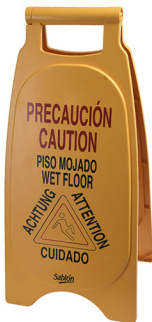
CABALLETE PISO MOJADO COD: JR248