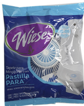
TAPETE PARA MINGITORIO CON PASTILLA AZUL WIESE AZUL LAVANDIA 85G COD: QM039