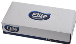
PAÑUELO FACIAL ELITE ELITE PREMIUM RECTANGULAR COD: PP008