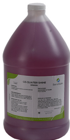
QUATER SHINE DESINFECTANTE CUATERNARIO GALON