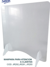
MAMPARA PARA ATENCION A CLIENTES COD: JR292, JR319, JR293