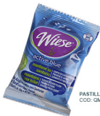
TAPETE PARA MINGITORIO LISO WIESE COD: QM042