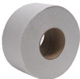
PAPEL HIGIENICO ELITE BOBINA JR 250M COD: PP002