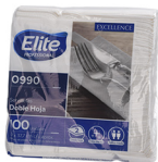
SERVILLETA ELITE MANTEL DE LUJO BLANCA COD: PP017