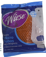
TAPETE PARA MINGITORIO ANTISALPICADURAS WIESE MANGO-NARANJA C10 COD: QM034

QM084 TAPETE PARA MINGITORIO ANTISALPICADURA WIESE MANGO-NARANJA QM039 TAPETE PARA MINGITORIO CON PASTILLA WIESE AZUL LAVANDIA 85G QM042 TAPETE PARA MINGITORIO LISO WIESE