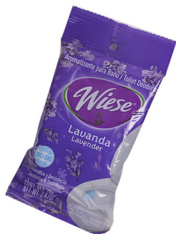
PASTILLAS DESODORANTES REDONDAS WIESE COD: QM038