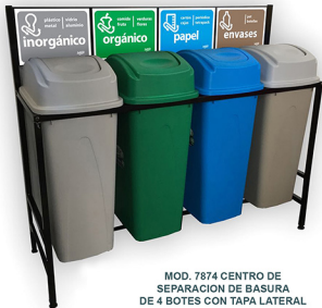
MOD. 7874 CENTRO DE SEPARACION DE BASURA DE 4 BOTES CON TAPA LATERAL