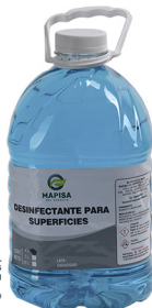
DESINFECTANTE ANTIBACTERIAL PARA SUPERFICIES MAPISA GALON