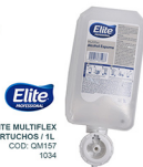
ALCOHOL EN ESPUMA ELITE MULTIFLEX 6 CARTUCHOS / 1L COD: QM157 1034