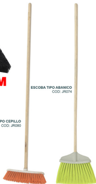
ESCOBA TIPO ABANICO COD: JR074