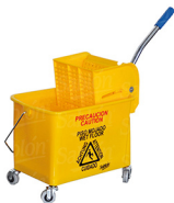
MOD. 8203 AM CUBETA EXPRIMIDOR 20 LITROS