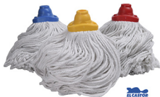
REPUESTO DE TRAPEADOR MOD 400 TWISTER COD: JR020, JR024, JR189