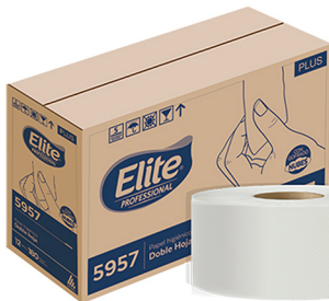
PAPEL HIGIENICO ELITE BOBINA JR 180M COD: PP001