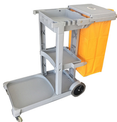
824 GR CARRITO MULTIFUNCIONAL DE LIMPIEZA CON TAPA